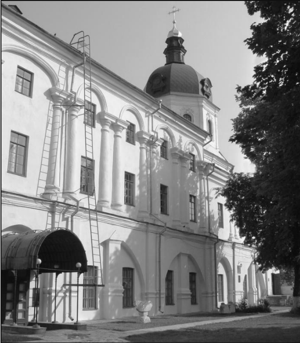
Старий корпус Національного університету “Києво-Могилянська академія” (побуд. у 1697–1702 рр.).

А ось що філософ писав про всесвітньовідомого польського астронома Миколая Коперніка у примітках до 28-ї Пісні “Саду Божественних пісень”: “Коперник єсть новейший астроном. Ныне его систему, сиречь план, или типик, небесных кругов весь мир принял. Родился над Вислою в польском городе Торуне. Систему свою издал в 1543 г. Сфера єсть слово еллинское, славенски: круг, клуб, мяч, глобус, гира, шар, круг луны, круг солнца” [1, 2, 7, 8].