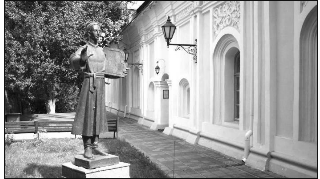
Будівля кол. Переяславського колегіуму, тепер Музей Г. Сковорода, м. Переяслав-Хмельницький, вул. Г. Сковорода, 52.

вчальний текст органічно поєднано із власними малюнками автора. Це був перший ілюстрований словник у світі! Пізніше Г. Сковорода ґрунтовно опрацював творчий спадок Я. А. Коменського, про що свідчить його твір “Алфавіт або Буквар миру”, прикрашений його власними ілюстраціями [11].