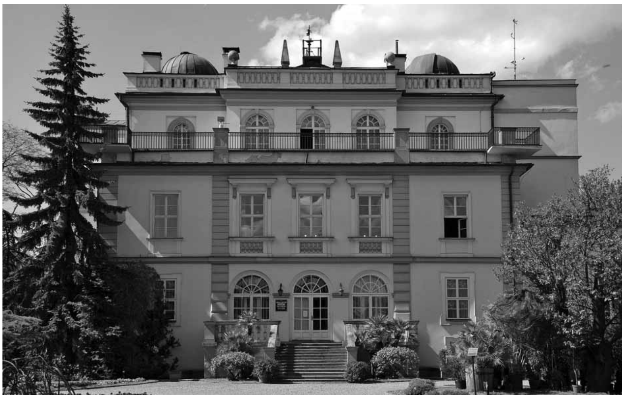
Obr. 3 Krakov, budova první hvězdárny Jagellonské univerzity (tzv. Collegium Śniadeckiego)