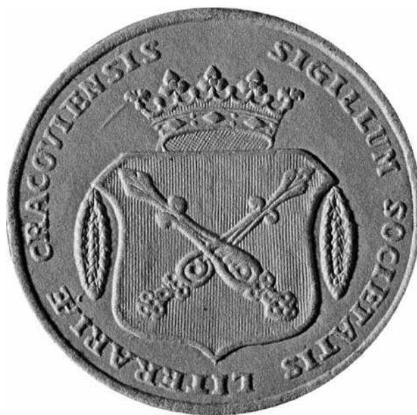
Obr. 6 Otisk razítka Krakovské vědecké společnosti [14]